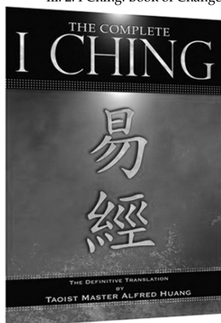
Ill. 2: I Ching. Book of Change

For det andet skal man skal bruge en udgave af „ I Ching . Forandringens Bog”, se Ill. 2.